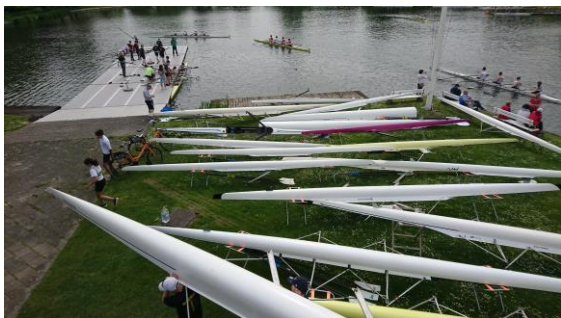
Een overvol botenpark !