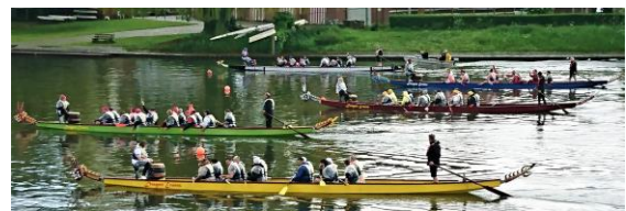
De 5 “dragon boats” na de finale

De Nederlandse firma PVG, met zetel in de haven van Gent, deed beroep onze lokalen en organisatiesteun voor de viering van hun 40-jarig bestaan. Het sportieve luik bestond uit een Drakenbootrace, waaraan personeelsleden uit 8 landen deelnamen.