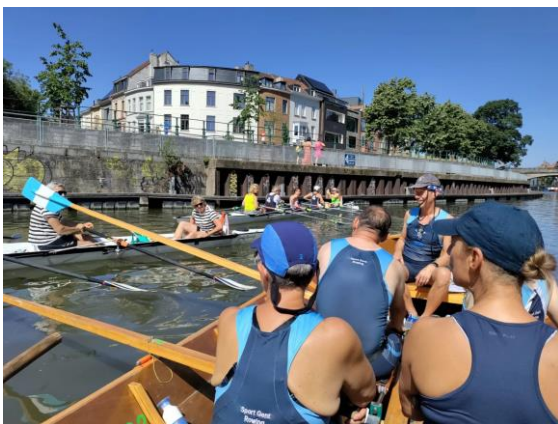
Onze recreanten in de kerkboot op de zonnige Gentse binnenwateren

De traditionele toertocht, georganiseerd door GRS, kende een mooie deelname, o.a. van ons “slagschip”.