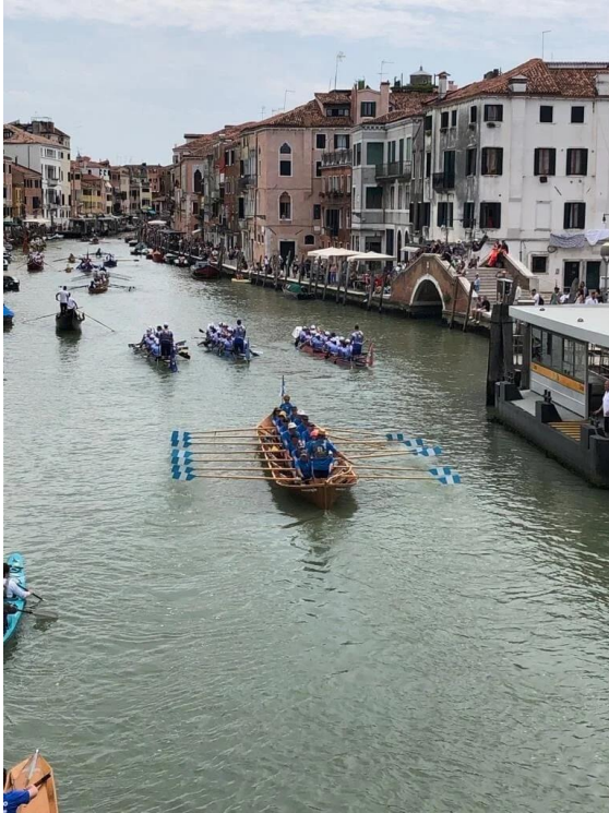
De kerkboot van Sport Gent op de Canal Grande

Een ruime delegatie van onze recreatieroeiers nam deel aan de iconische Vogalonga roeitocht in en rond Venetië. Voor een uitgebreid verslag verwijzen we nu reeds naar ons Jaarboek 2023.