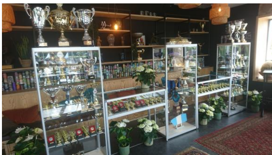
De mooi gestoffeerde medaille- en trofeekast