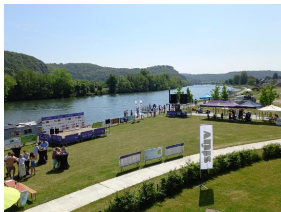
Algemeen beeld van de puike locatie én organisatie door RCND in Anhée.